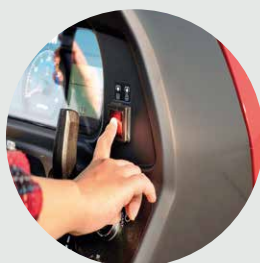
Tomada de força eletro hidráulica