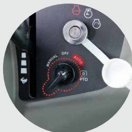
Dispositivo automático à TDF