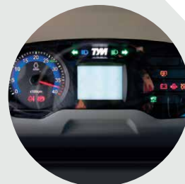
Painel de instrumentos digital